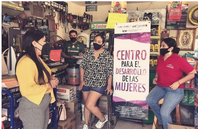
CDM SAN PEDRO COMUNIDAD